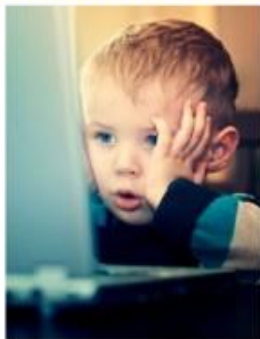
Интернет может быть опасен!

ДЕТЯМ ДО 5 ЛЕТ НЕ РЕКОМЕНДУЕТСЯ ПОЛЬЗОВАТЬСЯ КОМПЬЮТЕРОМ. ДЕТЯМ 5-7 ЛЕТ МОЖНО ОБЩАТЬСЯ С КОМПЬЮТЕРОМ НЕ БОЛЕЕ 10-15 МИНУТ В ДЕНЬ 3-4 РАЗА В НЕДЕЛЮ.